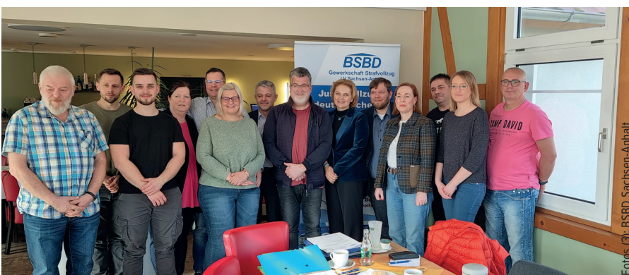
Arbeitsgespräch mit dem MJ u. dem Mitgliedern des Rechtsausschusses vom LSA

Und zu guter Letzt: Der Landtag des Landes Sachsen-Anhalt hat am 16. Dezember 2025 das Fünfte Gesetz zur Änderung dienstrechtlicher Vorschriften beschlossen, womit die Ruhegehaltsfähigkeit der Vollzugszulage wieder eingeführt wird. Anspruchsberechtigt sind potentiell bis zu 870 Beamte im Justizvollzug. Von der Ruhegehaltsfähigkeit der Stellenzulagen begünstigt sind alle Beamten, die ab dem Jahr 2026 in den Ruhestand treten oder in diesen versetzt werden.