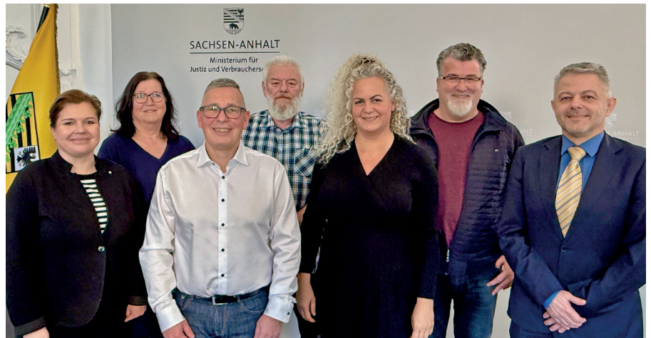
BSBD im Arbeitsgespräch mit der Justizministerin Frau Weidinger

Apropos Personal: Das Justizministerium Sachsen-Anhalt hat seine Nachwuchswerbung auch für den Justizvollzug neu aufgestellt. Die Kampagne für den Justizvollzug wurde überarbeitet – mit einem neuen frischen Design und einem klaren Ziel: junge Menschen für eine Karriere im Justizvollzug zu gewinnen. Auf Plakaten,