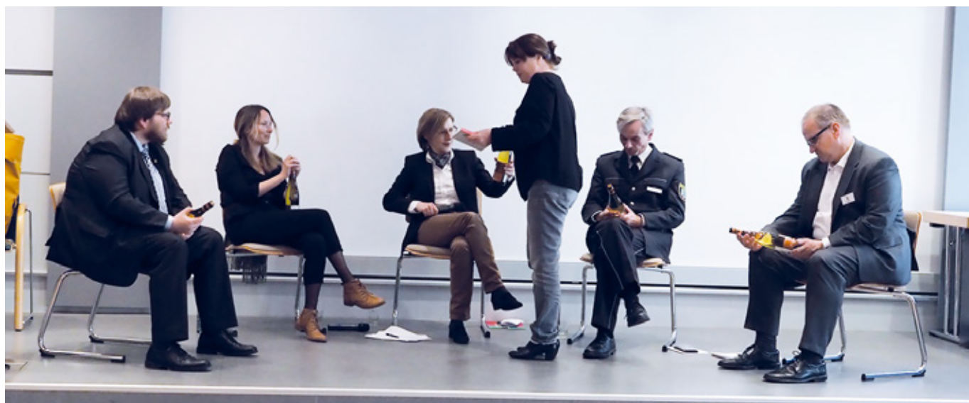
Podiumsdiskussion der AL-Teilnehmer.

perfekt vereint werden konnten. Insgesamt ist damit gelungen, Sachsen-Anhalt, den sachsen-anhaltinischen Strafvollzug und hier insbesondere auch die JVA Burg dem bundesweiten Publikum überaus positiv zu präsentieren. ■