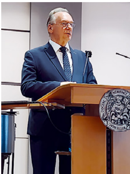
Ministerpräsident Dr. Reiner Haseloff spricht Grußworte.

Aber auch Themen anderer Bundesländer, des Bundesjustizministeriums sowie die Vorstellung des österreichischen Strafvollzugssystems standen auf dem Programm. Abgerundet wurde