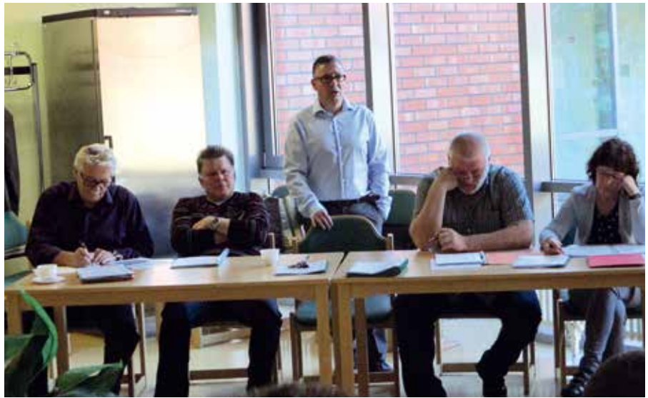
Der scheidende Landesvorstand gibt seinen Rechenschaftsbericht ab.